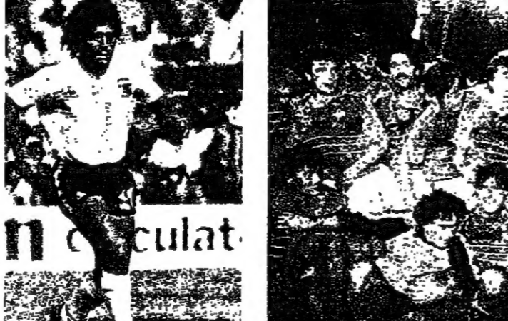
منتخب فرنسا حقيقياً بعمريه ميشال هيدالغو في صورة تذكارية بعد احراز كأس الامم الاوروبية ١٩٨٤